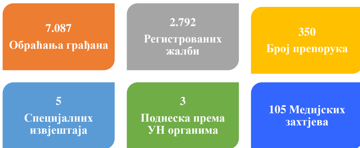
Графикон 1. Преглед основних индикатора везаних за рад Институције

Током 2024. године Институција омбудсмена запримила је укупно 2.792 жалбе. У 2024. години укупно је архивирано 2.690 предмета, од тога 1.704 предмета из 2024. године и 986 предмета из претходних година. Током извјештајног периода Институцији омбудсмена укупно се обратило 7.087 грађана (директни контакти, писмени контакт, телефонски позиви, електронска пошта и писане жалбе). У графикону 2 дат је приказ обраћања грађана Омбудсменима БиХ у 2024. години.