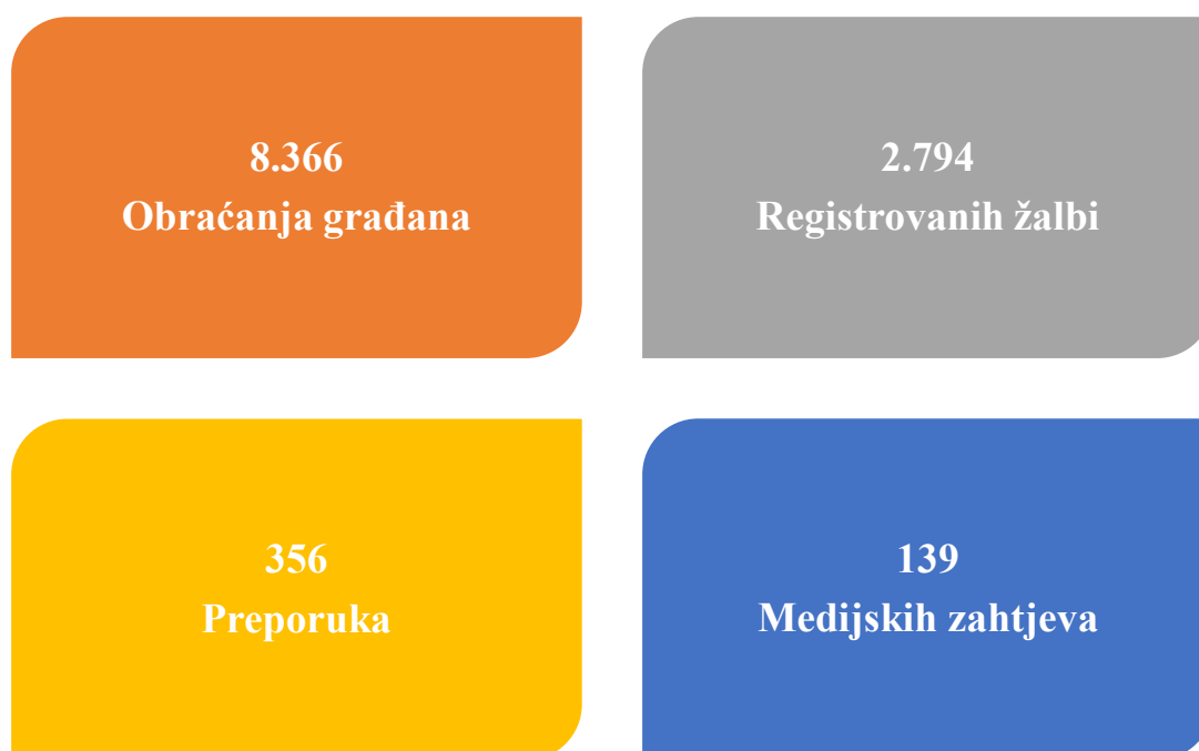
Grafikon 1. Pregled osnovnih pokazatelja vezanih za rad institucije

Tokom 2023. godine Institucija ombudsmena zaprimila je ukupno 2.794 žalbe. U 2023. godini ukupno je arhiviran 2.831 predmet, od toga 1.686 predmeta iz 2023. godine i 1.145 predmeta iz prethodnih godina. Tokom izvještajnog perioda Instituciji ombudsmena ukupno se obratilo 8.366 građana (direktni kontakti, pismeni kontakt, telefonski pozivi, elektronska pošta i pisane žalbe). U grafikonu 2 dat je prikaz obraćanja građana Ombudsmenima BiH u 2023. godini.