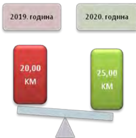
Слика број 6 Висина дјечјег додатка

додатак износи 40,00 КМ мјесечно по дјетету, а износ увећаног додатка је 50 КМ. У 2020. години, дјечји додатак је износио 25,00 КМ, док за породице које имају троје и више дјеце дјечји додатак је износио 42,00 КМ, а увећани износ дјечјег додатка је остао исти као и у 2019. години, 50 КМ.