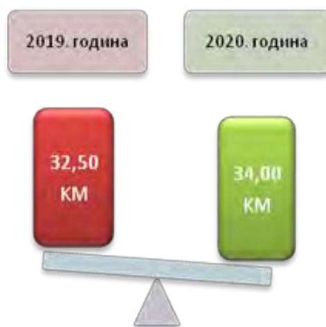
Слика број 8 Висина дјечјег додатка

Од свих надлежних служби/центра на подручју овог кантона издвајамо сљедеће податке: Центар за социјални рад Нови Травник је током 2019. године разматрао 13 захтјева за признавање права на дјечји додаток, с напоменом да је само један захтјев одбијен.