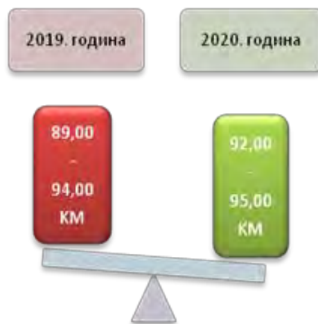
Слика број 11 Висина дјечјег додатка

Када је у питању висина дјечјег додатка, како је већ наведено износи 10% од просјечне плате у дистрикту, увећан је за 50% за одређене категорије и у 2019. години износио је између 89,00 и 94,00 КМ, односно увећани дјечји додаток износио је 134,00 и 140,00 КМ. У 2020. години висина дјечјег додатка износила је између 92,00 и 95,00 КМ, односно 139,00 и 142,00 КМ за увећани дјечји додаток.