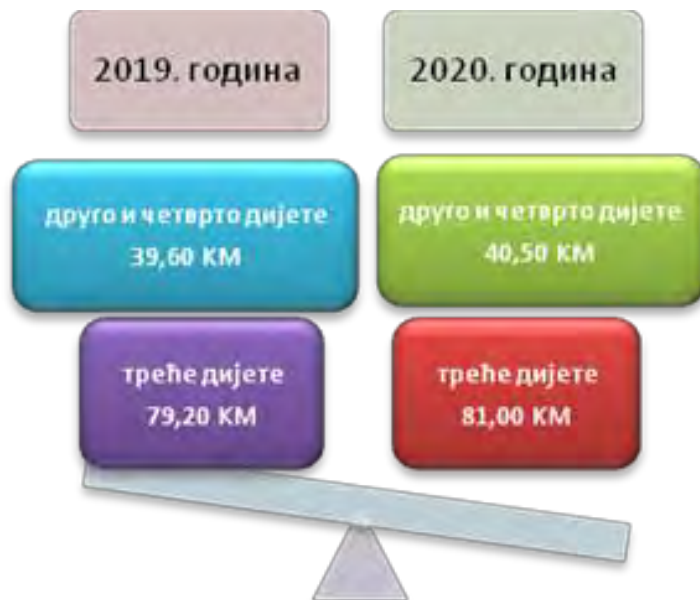
Слика број 10 Висина дјечјег додатка

која право остварују независно од материјалних услова и без обзира на ред рођења, у складу са чланом 19. Законом о дјечјој заштити, 101,20 КМ. У 2020. години дјечји додатак износио је за друго и четврто дијете 40,50 КМ, а за треће дијете 81,00 КМ, док је за дјецу под старатељством и дјецу која право остварују независно од материјалних услова и без обзира на ред рођења, у складу са чланом 19. Законом о дјечјој заштити, 103,50 КМ.