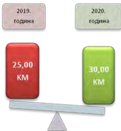
Слика број 3 Висина дјечјег додатка

На подручју овог кантона број становника - 222.007, у 2019. години разматрали су 1.203 захтјева за признавање права на додатак, од тога су 19 захтјева одбили. У 2020. години разматрали су 1.189 захтјева, од тога су 11 захтјева одбили, односно одбацили.