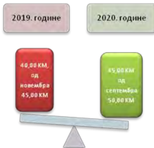
Слика број 2 Висина дјечјег додатка

јасно прописује документација потребна за остваривање права на додатак и остала питања од важности за примјену Закона о додатку за дјецу. Када су у питању подаци који се односе на висину дјечјег додатка, Министарство здравства и социјалне политике Посавског кантона обавјештава Институцију омбудсмана да је висина дјечјег додатка за 2019. годину износила 40,00 КМ, с тим да је основица од 11. мјесеца 2019. године повећана за 5,00 КМ и износила је 45,00 КМ. У 2020. години, дјечји додаток је износио 45,00 КМ, али је од 9. мјесеца повећан за још 5,00 КМ, тако да сада износи 50,00 КМ.