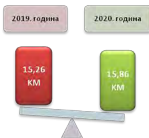
Слика број 1 Висина дјечјег додатка

Према достављеним статистичким подацима од надлежних центара за социјални рад/служби социјалне заштите на подручју кантона, током 2019. године разматрана су 1.133