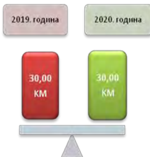
Слика број 5 Висина дјечјег додатка

Током 2019. године разматрали су 400 захтјева који се односе на остваривање права на дјечји додаток и да су четири захтјева одбијена, а током 2020. године разматрано је 327 захтјева и три захтјева су одбијена.