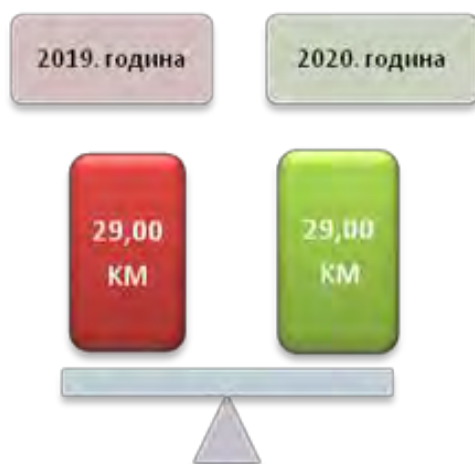
Слика број 7 Висина дјечјег додатка

Током 2019. године разматрали су 86 захтјева који се односе на дјечји додатак и само су три захтјева одбијена, а током 2020. године тај број је износио 92, док је осам захтјева одбијено.